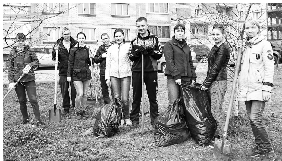
Жители многоквартирного дома № 3 по улице Мирной в поселке Красный Бор показали пример активной работы во время субботника по наведению порядка на придомовой территории